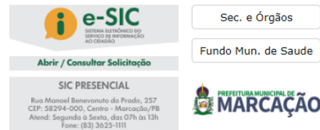
Figura 6 - Acesso rápido