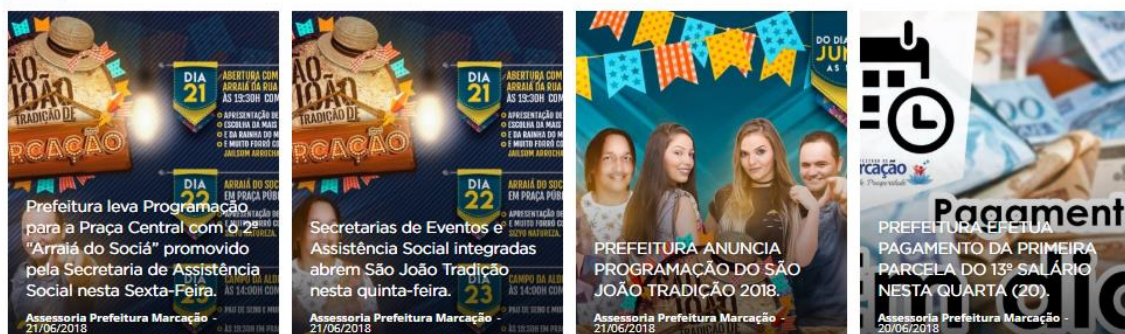
Figura 8 - Galeria de mídias