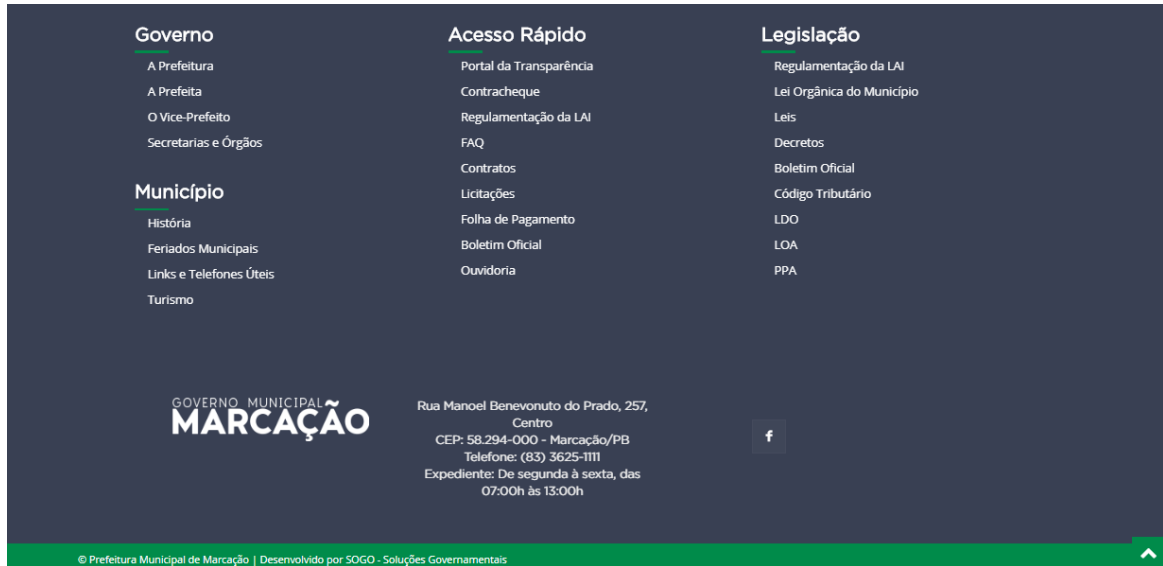
Figura 9 - Rodapé

No rodapé é disponibilizado o mapa do site , com todos os menus, acessos e seus respectivos links. Além disso, no rodapé também é disponibilizado a logomarca do ente, informações de localização, contato e ícones de redes sociais.