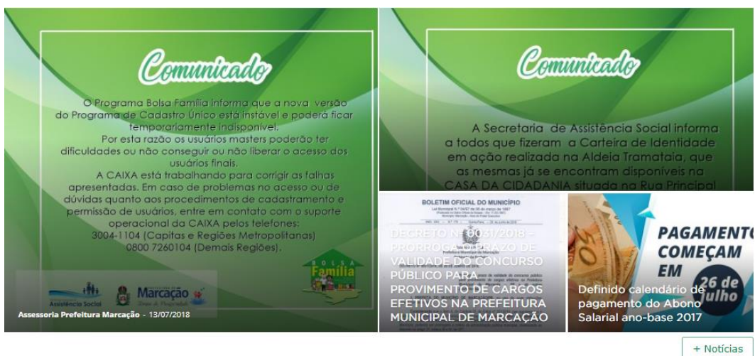
Figura 5 - Módulo de notícias mais recentes

O módulo de notícias é onde ficam disponibilizadas as notícias mais recentes postadas no site. As notícias postadas se referem a atos da gestão do ente ou divulgação de prestação de algum serviço.